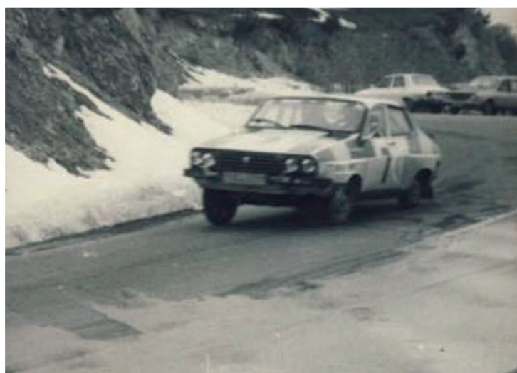
1989, Secvență de pe Proba Specială „Poiana Brașov” 1989, Sequence from the ”Poiana Brașov” Special Stage

Upon becoming a part of the national sports calendar, the Brasov Rally rapidly gained recognition and became a part of international competitions that crossed Romania: the Romanian Rally and the Balkan Rally .