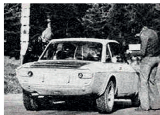
1977, Eugen Ionescu Cristea la Raliul Zăpezii 1977, Eugen Ionescu Cristea at the Snow Rally

As we can note, both city circuit races and high-speed races on mountainous terrain (gravel) on what would become the most beautiful road rally course, the Poiana Road.